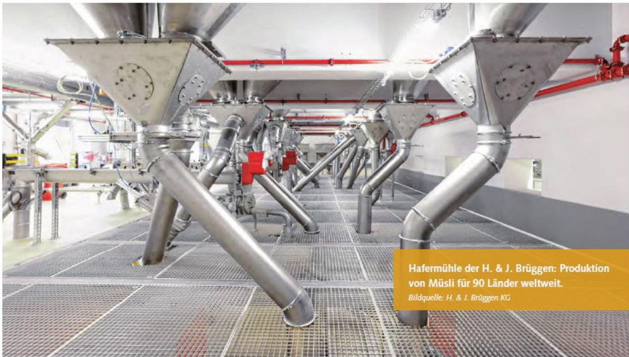
Hafermühle der H. & J. Brüggens: Produktion von Müsli für 90 Länder weltweit.

Eingehende Dokumente, sei es in Papier- oder elektronischer Form, schnell im Unternehmen weiterzuarbeiten und in die nachfolgende ERP-Landschaft zu integrieren – diese Aufgabe übernehmen bei zahlreichen SAP-Anwendungsternehmen bereits spezielle Workflowsysteme. Im Bereich der Ausgangspost gibt es jedoch noch viel zu verbessern.